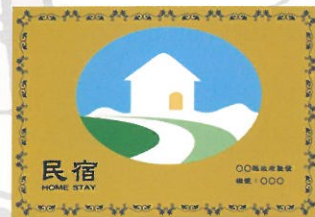
合法民宿專用標識